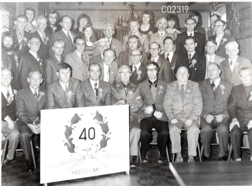
Foto uit Maashees C02319 misschien een jubileum van Havens? Waar en wanneer was dat?

Veel succes met speuren www.stichtingdeoudeschoenendoos.nl info@stichtingdeoudeschoenendoos.nl