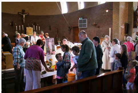
Ophalen Corneliusbrood en Corneliuswater