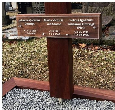
Op 13 januari 2021 is daarop een nieuw Kruisbeeld geplaatst.