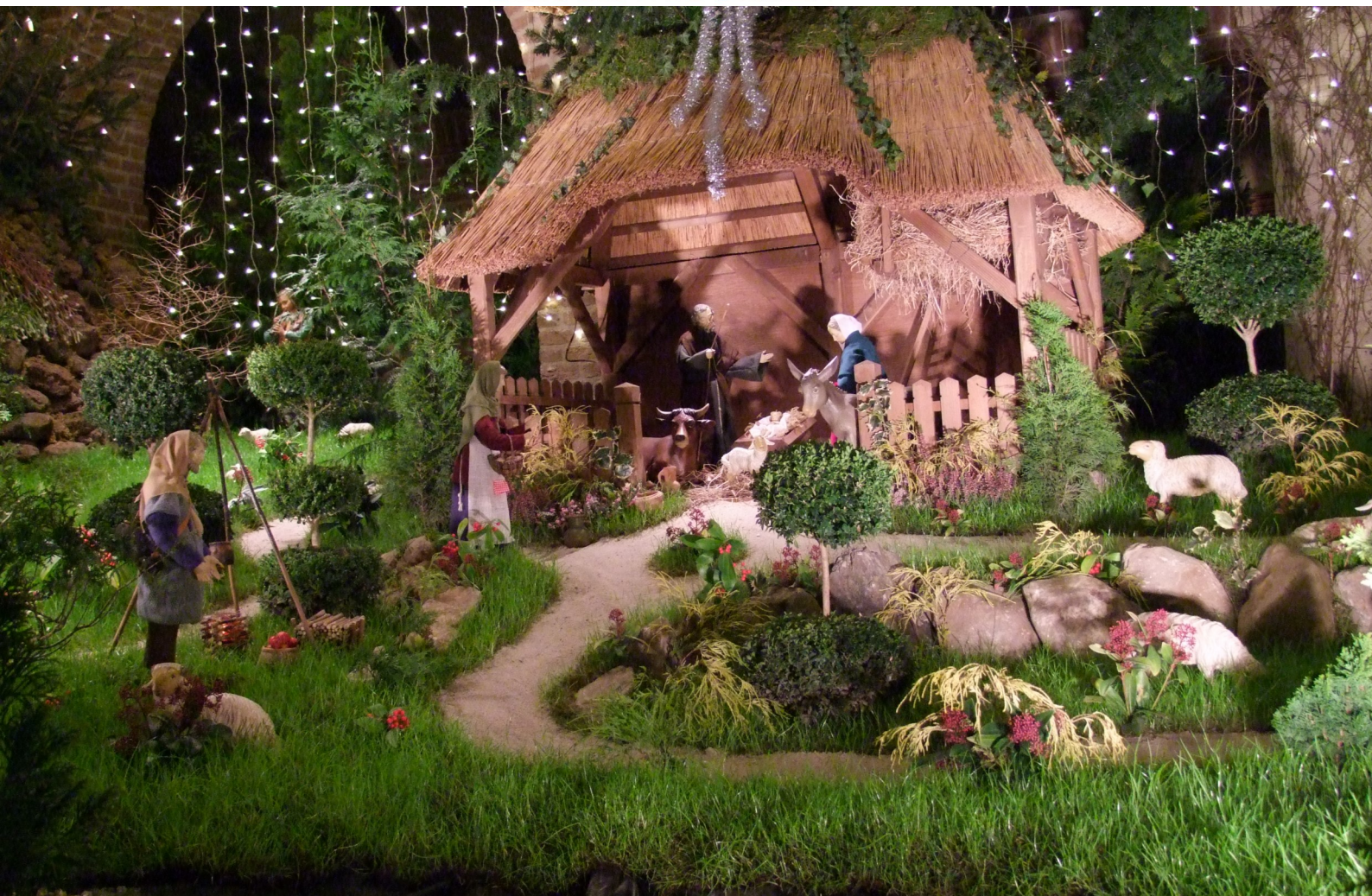
Foto: Kerststal St. Jan de Doperkerk, Sambeek