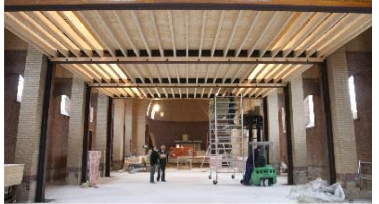
En buiten aan het nieuwe Cafe.....