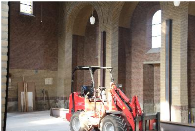
Volgend jaar komt verschijnt hier de 58e Prins der Plekkers ten tonele: