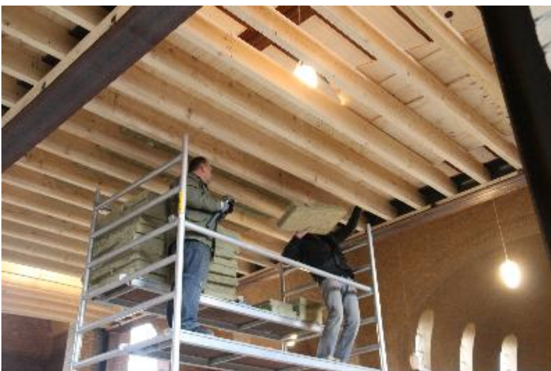
Binnen wordt hard gewerkt aan de tussenvloer.....