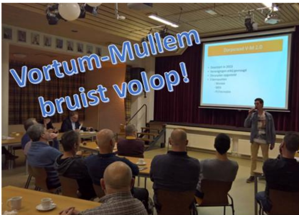
Mooi vol Gemeenschapshuus tijdens bezoek van college van B&W Boxmeer aan Vortum-Mullem

#positieve_energie #leefbaarheid #toekomstplannen #môi_durpke