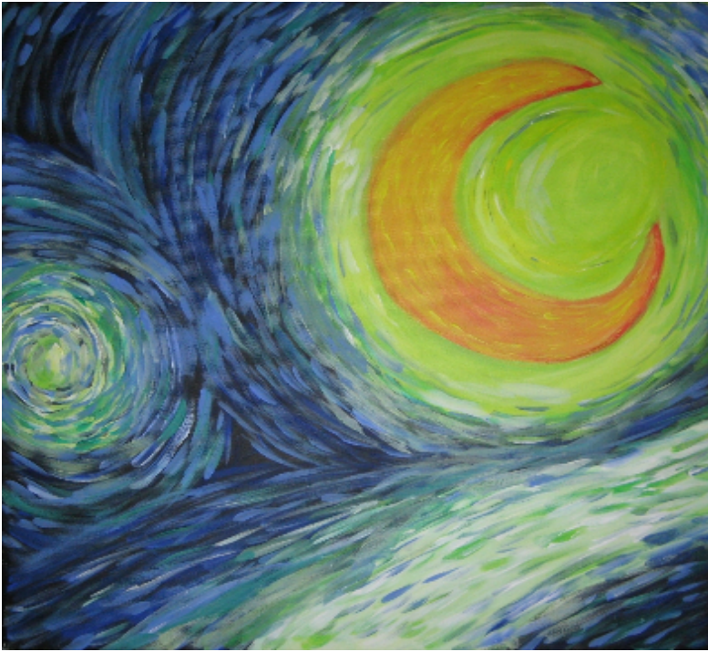
Zij die licht zien, kijken in het rond