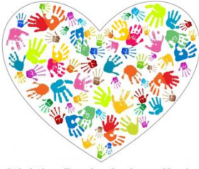
Stichting Furaha Orphans Kenia

Zo langzamerhand komt mijn vertrek naar Kenia weer dichterbij.