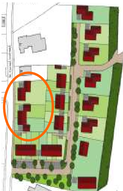
Stedenbouwkundig plan met variant tnv de boerderij

De stukken liggen van 16 oktober tot en met 26 november ter inzage. De stukken kun je vanaf 16 oktober a.s. downloaden van site van de gemeente.