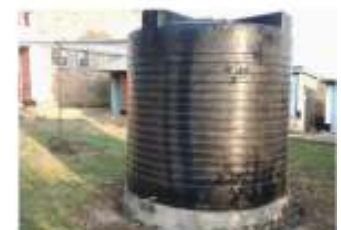
tank voor opvang regenwater