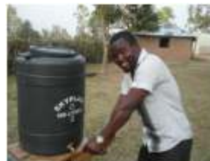
handen wassen na het plassen