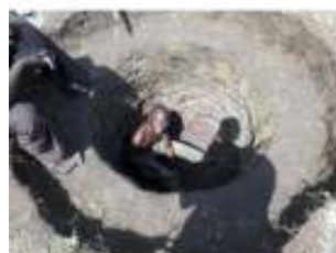
waterput in de maak