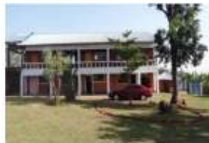
Furaha Centre, na