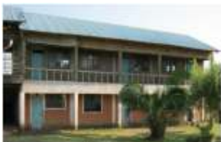
Furaha Centre, voor