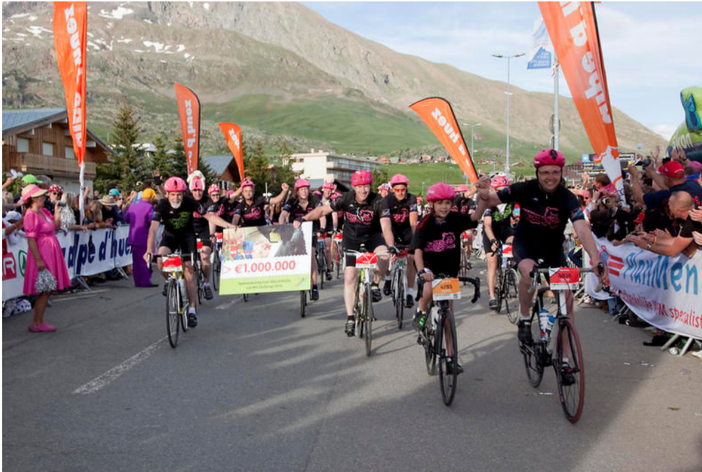
De teamleden van BIG Challenge Hendrix UTD kwamen op 7 juni in de avond 'en groupe' over de finish.

Alpe d'Huez beklommen. Ze hebben hiermee 117.000 euro opgehaald ten bate van kankeronderzoek. Onder hen ook een groot aantal rijders uit het Land van Cuijk.